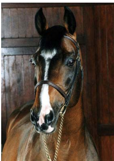
fig. ROBIN Z I

Mais tarde, nos anos 90, RAMIRO produziu garanhões de alto nível em todas as Associações Europeias, como RITUAL e RABINO em Hannover, RAMONUS em Oldenburg, ROMANTIKER, ROBIN Z I (saltador internacional e pai das excelentes BUTTERFLY FLIP e MYNTHA e II ROYAL Z II na Suécia, ROMINO em Holstein, ZEOLIET, ARMSTRONG, JACOMAR e BERNSTEIN na Holanda e os reprodutores Zangersheide, que na época eram registrados em Hannover também. A influencia de RAMIRO na criação Holandesa ainda é de grande importância. Ele foi laureado Cavalo do Ano em 1992.