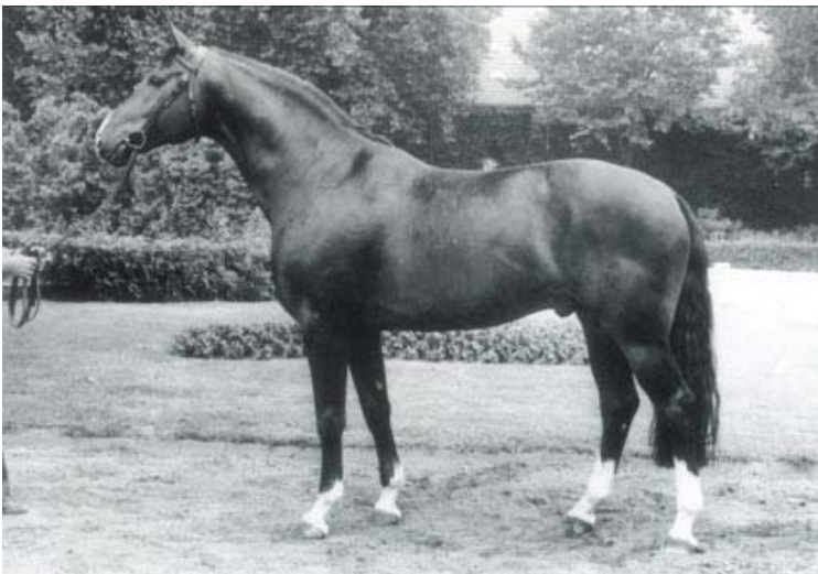
Fig. Romadour II

RADETZKY, filho de RAMZES, estabeleceu uma linhagem própria na Westfalia que via seu filho ROMULUS, produziu o garanhão ROMADOUR II, pai do Olímpico REMBRANDT, do garanhão RENOIR e avô do super-produtor de cavalos de adestramento RUBINSTEIN. RUBINSTEIN é hoje um dos maiores produtores de movimento espetacular, sendo utilizado na Westfalia, Oldenburg, Hessen e Hannover, sistematicamente nas linhagens de Adestramento.