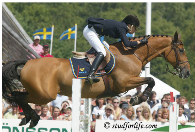
Fig. BUTTERFLY FLIP