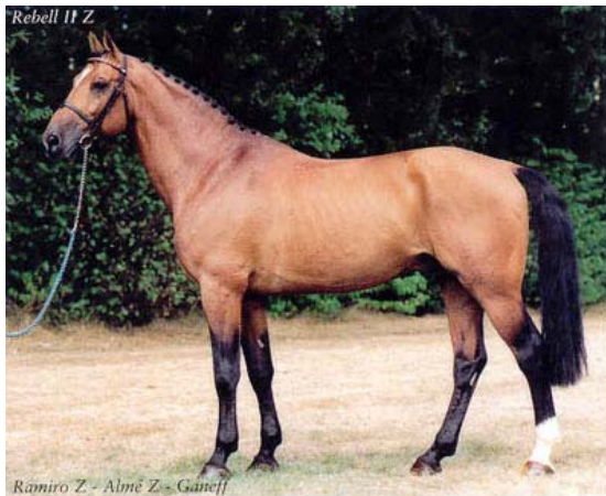
Fig.: REBELL II Z

interessantes, como o caso de REXITO e aqui no Brasil HFB-SALAMANDRA REVENGE, que acabou exportado para o próprio Zangersheide.