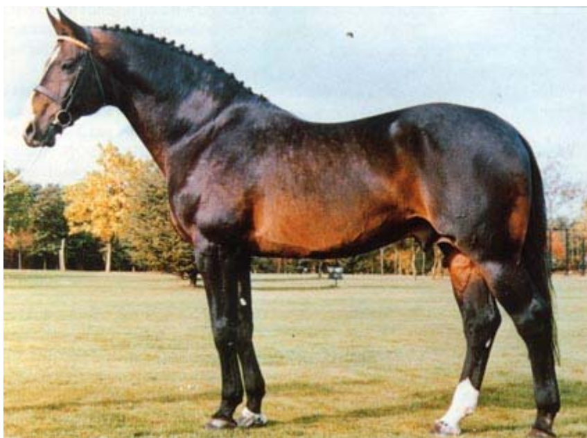
Fig. RAMIRO Z

RAMIRO foi o mais popular distribuidor dos genes de seu avô RAMZES e o mais demandado garanhão da Alemanha. Ele cobriu na Westfalia, em Holstein, em Zangersheide e na Holanda. Uma enorme quantidade de filhos seus conserva e passa adiante seus importantes genes para salto e montabilidade. Em todos os Studbooks citados acima e em outros mais encontramos seus filhos e netos competindo em nível Top.